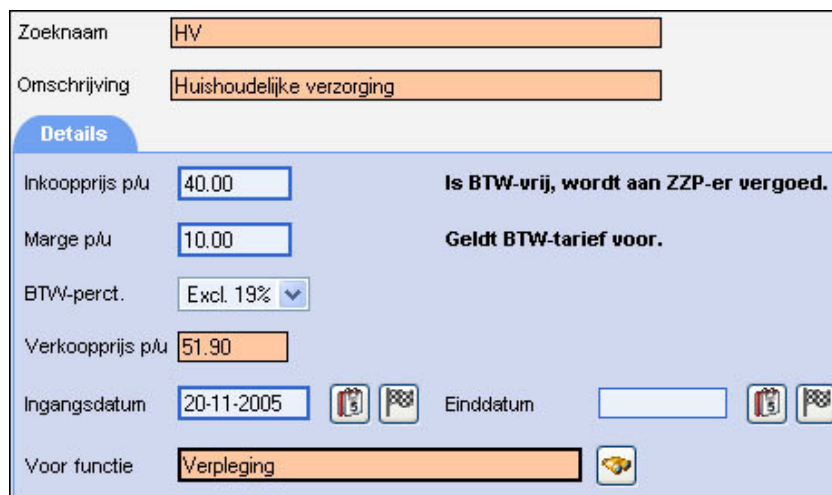
Figuur 2: Overzicht van prijsinformatie voor het zorgartikel "Huishoudelijke Verzorging"

Na een opslaan-actie wordt een totaalprijs (verkoopprijs p/u) berekend die aan de cliënt wordt gefactureerd. Deze berekende prijs geldt voor zorg geleverd binnen (!) de grenzen van de opgegeven geldigheidsperiode door een ZZP'er die de opgegeven functie vervult.